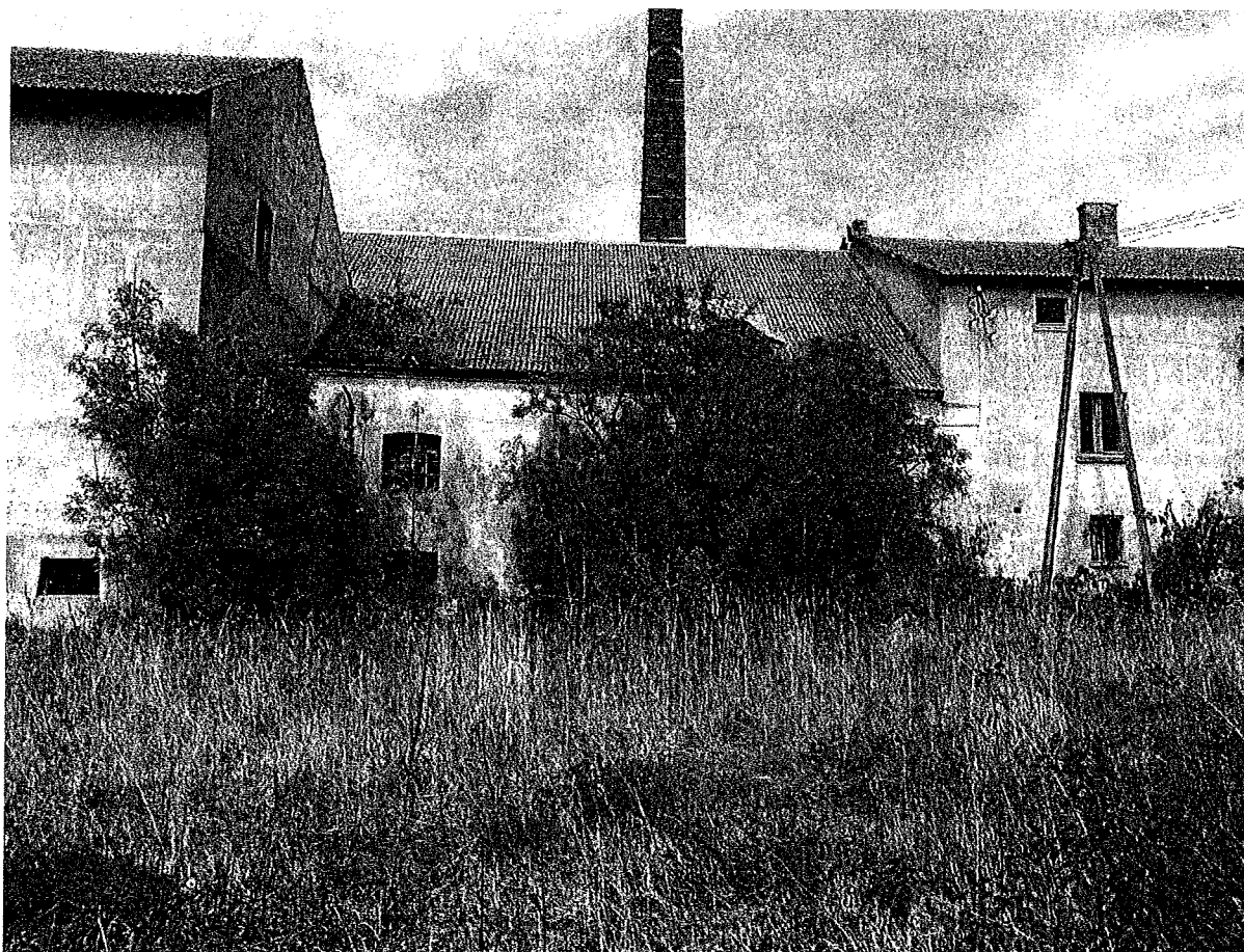
Zdjęcie przedstawia fragment gorzelnii od strony północnej.

W 2023 roku planuję rozpocząć pierwsze prace zabezpieczające zdegradowany budynek. W przeprowadzonej w 2022 roku inwentaryzacji zostały one wskazane, jako roboty do natychmiastowej realizacji. Do wieloletniej prognozy finansowej na lata 2022-2024 wpisane zostało zadanie pn.: „ Opracowanie inwentaryzacji i dokumentacji oraz roboty budowlane zabezpieczające celem adaptacji dawnej gorzelnii na cele muzealne ”.